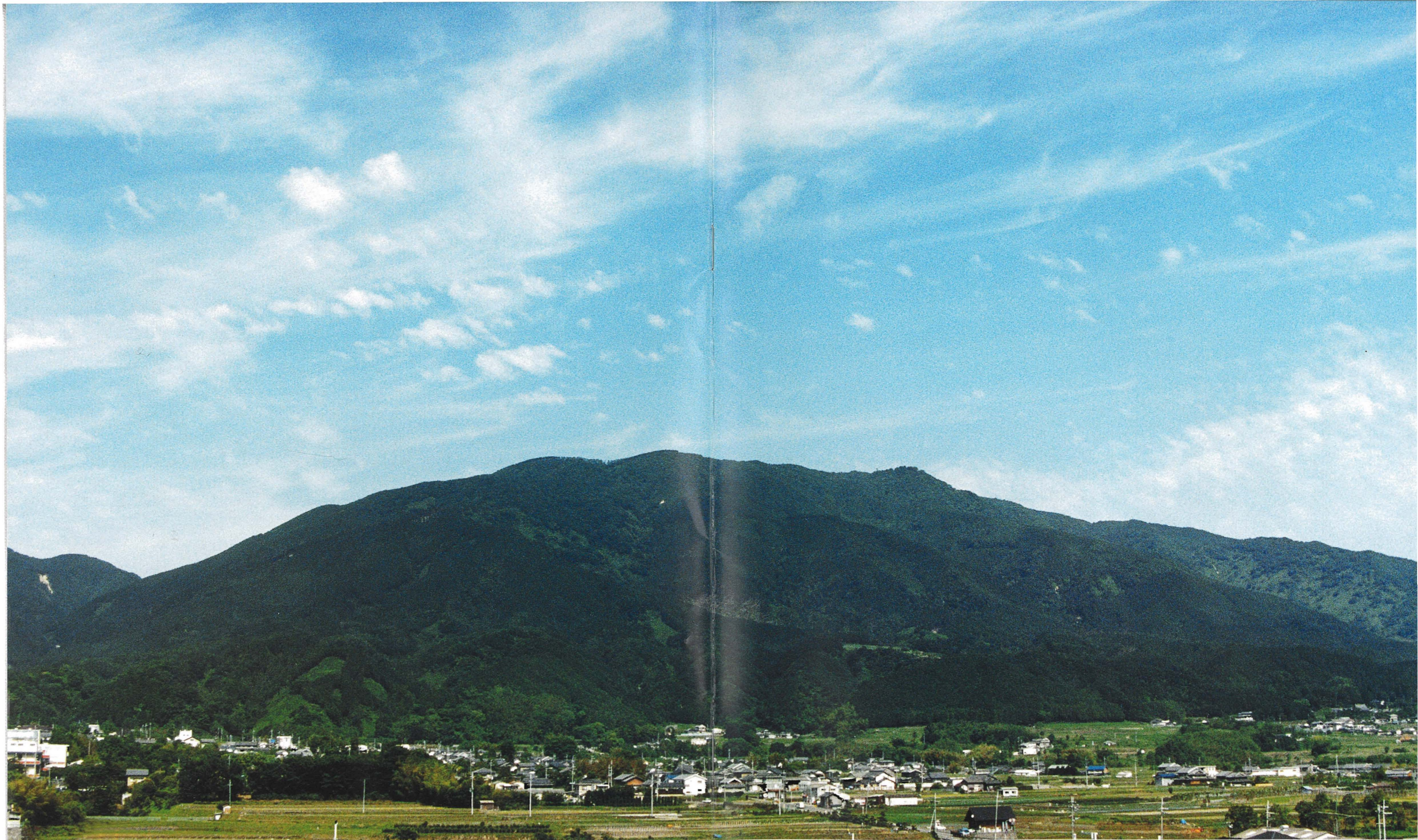
本社屋上より眺む葛城山